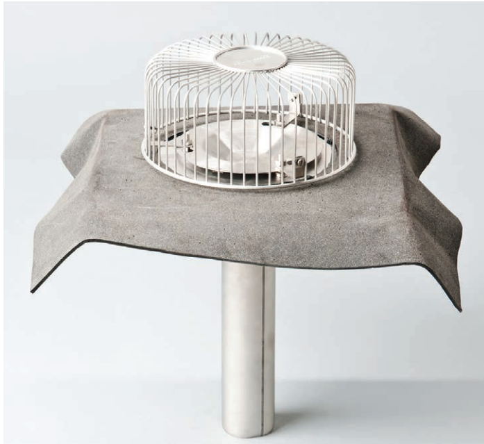
Unterdruck-Gully aus Edelstahl mit Bitumenkragen (Oberteil) mit Anschlussbahn aus Bitumen, Vakuumteller und Kiesfangkorb.