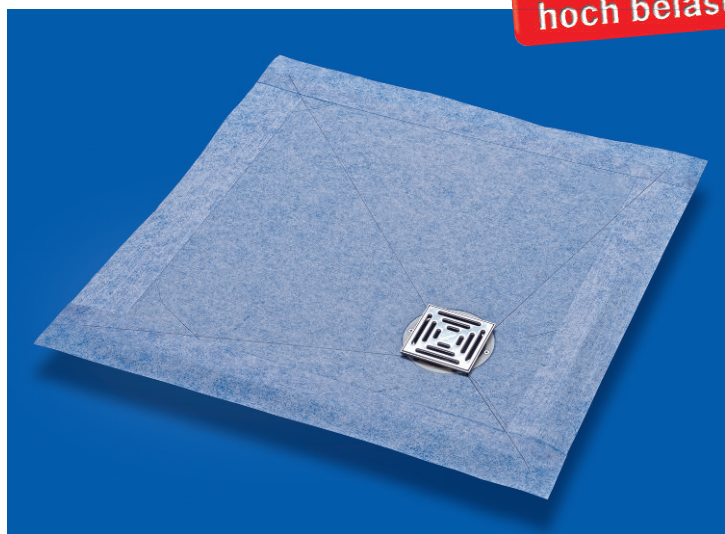
Duschbodenelement »superflach« aus PUR 900x900x25 mm mit dezentralem Ablauf