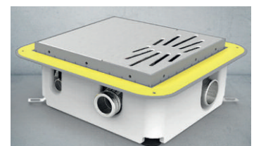
Zur Verfügung stehen: Jung Plancofix (Abb. oben) und Jung Plancofix Plus (Abb. links)