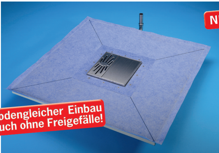
Duschbodenelement aus PUR 1200 x 1200 x 25 mm mit eingebauter Jung Plancofix Bodenablaufpumpe