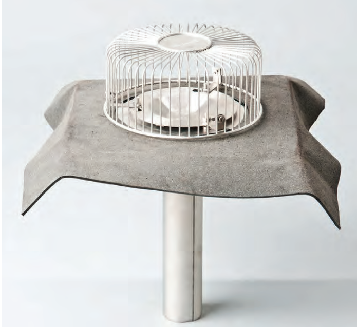
Unterdruck-Gully aus Edelstahl mit Bitumenkragen (Oberteil) mit Anschlussbahn aus Bitumen, Vakuumteller und Kiesfangkorb.