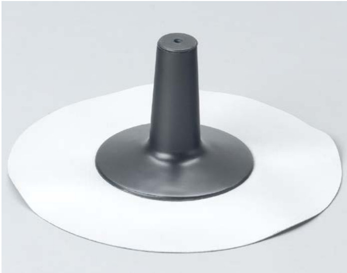
Befestigungsdurchführung aus PUR (schwarz) wärmegeklämt, FCKW-frei, mit integrierter Gummidichtung und eingeschäumter Anschlussbahn (Bitumen, PVC oder Sonderfolie).