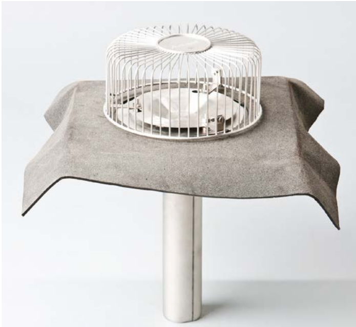
Unterdruck-Gully aus Edelstahl mit Bitumenkragen (Oberteil) mit Anschlussbahn aus Bitumen, Vakuumteller und Kiesfangkorb.