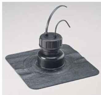
Auch als Kabeldurchführung nutzbar (Anwendungsbeispiel)