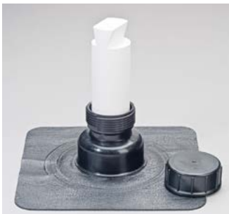
Passendes Element aus EPS zum Füllen von Revisionsöffnungen in der Dämmung