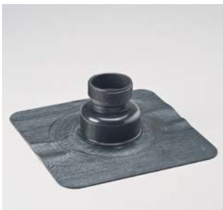
Große Durchgrifföffnung mit Schraubgewinde