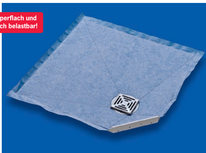
Eck-Duschbodenelement »superflach« aus PUR 900x900x25 mm mit dezentralem Ablauf, passend zur Eck-Installationsplatte aus PUR