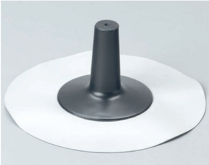
Befestigungsdurchführung aus PUR (schwarz) wärmegeklämt, FCKW-frei, mit integrierter Gummidichtung und eingeschäumter Anschlussbahn (Bitumen, PVC oder Sonderfolie).