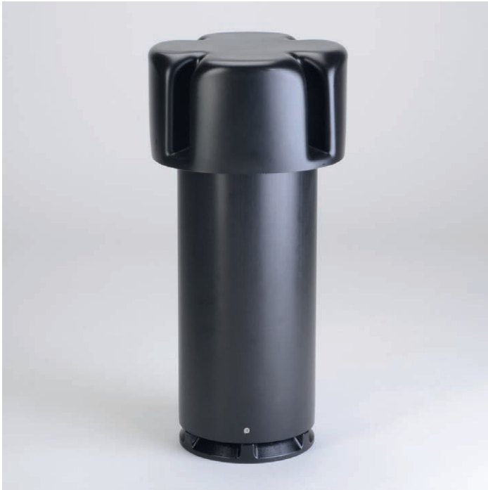
Grumbach-Kondenswasserableiter bestehend aus: Kondenswasser-Ableitring, Lüftungsrohr DN 150 (400 mm lang) und Regenhut DN 150