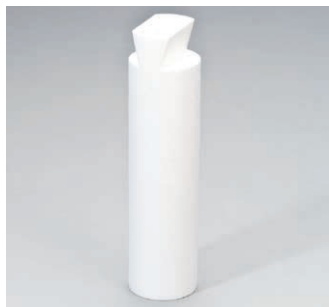
Passendes Element aus EPS zum Füllen von Revisionsöffnungen in der Dämmung

Abb. oben: Durchgriffvorrichtung mit aufgestecktem Regenhut DN 125, z. B. zur Trocknung der Wärme- dämmung