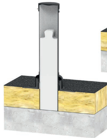
Abb. unten: Durchgriffvorrichtung DN 125 mit passendem EPS element