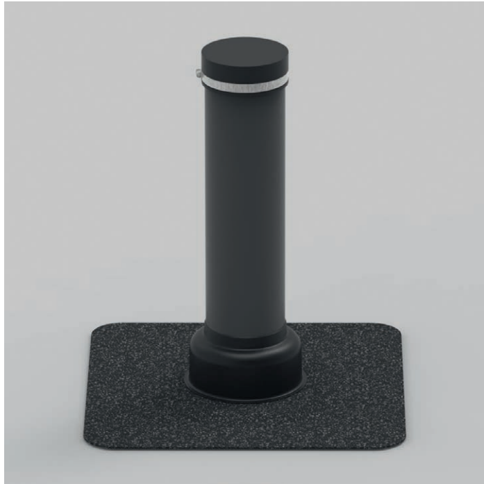
Durchgriffvorrichtung DN 125 mit Gummikappe und Schelle