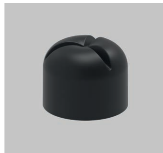
Regenhut DN 125