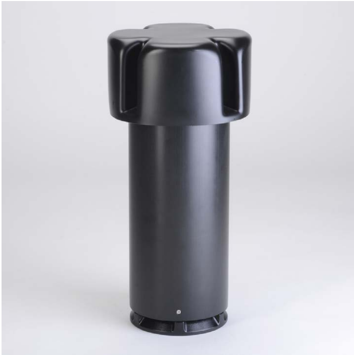
Grumbach-Kondenswasserableiter bestehend aus: Kondenswasser-Ableitring, Lüftungsrohr DN 150 (400 mm lang) und Regenhut DN 150