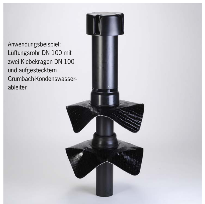
Anwendungsbeispiel: Lüftungsrohr DN 100 mit zwei Klebekragern DN 100 und aufgestecktem Grumbach-Kondenswasserableiter