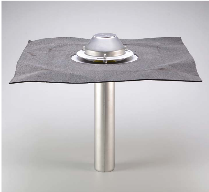
Unterdruck-Gully aus Edelstahl mit Bitumenkragen (Oberteil) mit Anschlussbahn aus Bitumen, Vakuumteller und Kiesfangkorb.