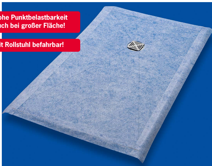
Duschbodenelement aus PUR 1200x2000x40 mm mit dezentralem Ablauf