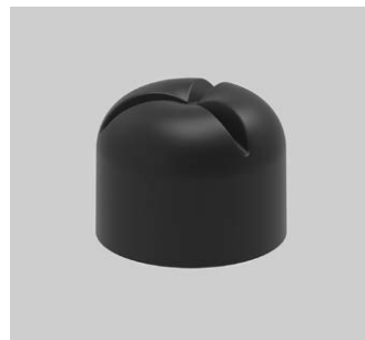
Regenhut DN 125