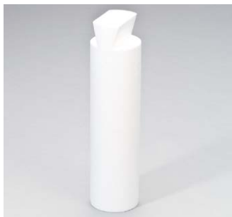
Passendes Element aus EPS zum Füllen von Revisionsöffnungen in der Dämmung