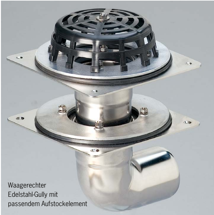
Waagerechter Edelstahl-Gully mit passendem Aufstockelement