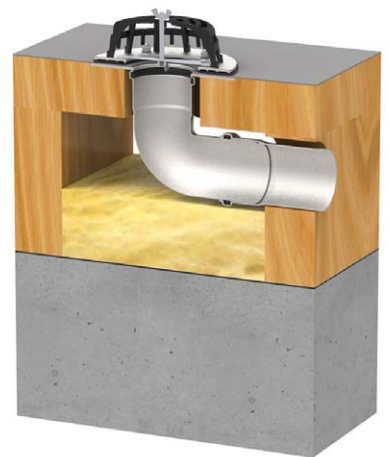
Edelstahl-Gully waagrecht DN 70 in einem belüfteten Dach